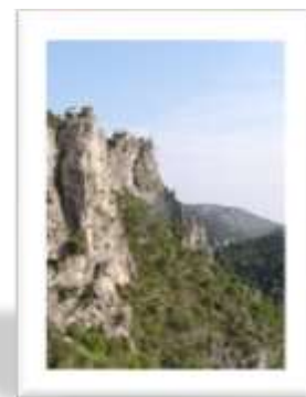
Les espèces et les habitats des zones rocheuses