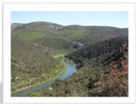
Les espèces et les habitats liés à l'Hérault