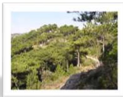
La forêt de pins de Salzman

80 % du site superposé au site « Oiseaux » Hautes garrigues du Montpelliérais